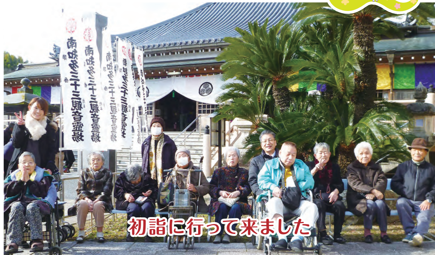
初詣に行って来ました