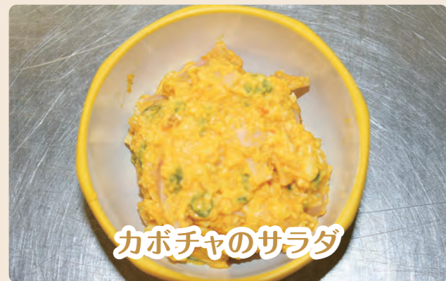
カボチャのサラダ